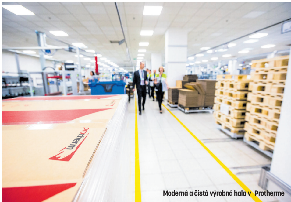
Moderná a čistá výrobná hala v Protherme

A ako to vo výrobe vyzerá? Pracuje sa v príjemnom pro-